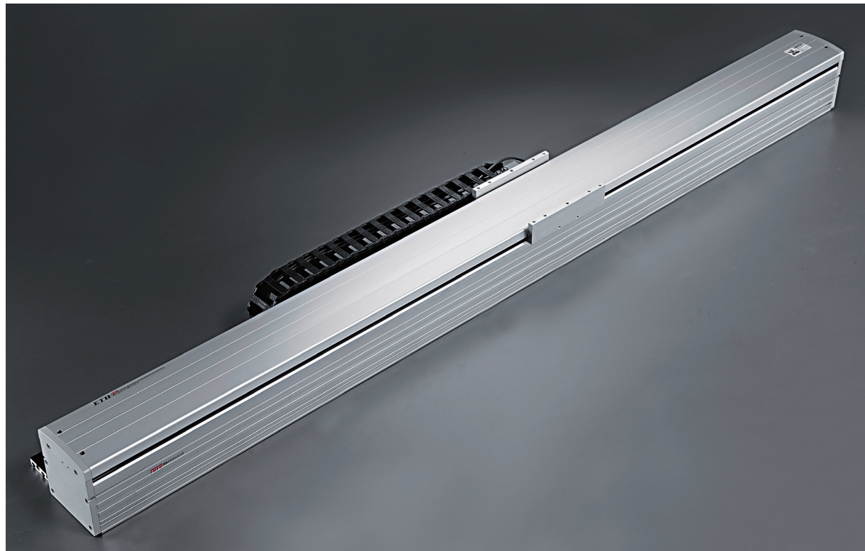
此圖僅供參考，出貨規格詳見尺寸圖面

免費服務專線：大陸 400-875-0009 台灣 0800-800-893 Toll-free Number China Taiwan